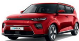
Inferno Red (AJR)