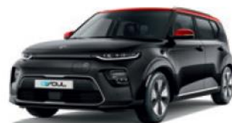
Cherry Black + Inferno Red (AH5)