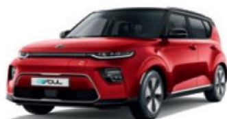
Inferno Red + Cherry Black (AH4)