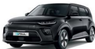
Cherry Black (9H)