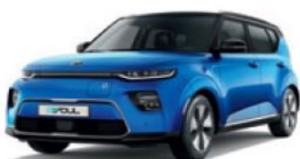
Neptune Blue + Cherry Black (SE2)