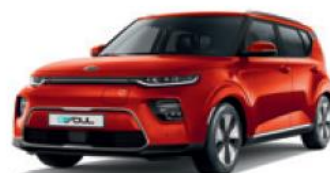
Mars Orange (M3R)