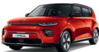
Mars Orange + Cherry Black (SE3)