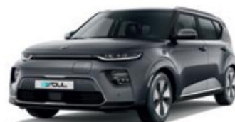
Gravity Grey (KDG)