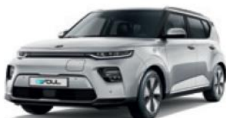
Sparkling Silver (KCS)