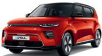
Mars Orange + Cherry Black (SE3)