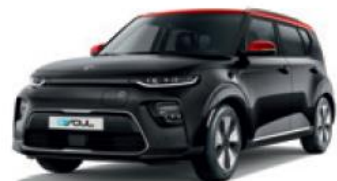
Cherry Black + Inferno Red (AH5)