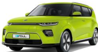
Space Cadet Green (CEJ)