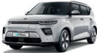
Sparkling Silver (KCS)