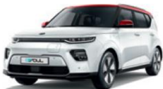
Clear White + Inferno Red (AH1)