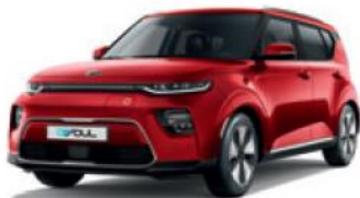
Inferno Red (AJR)