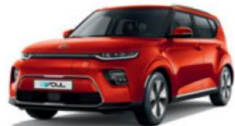
Mars Orange (M3R)