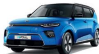
Neptune Blue + Cherry Black (SE2)