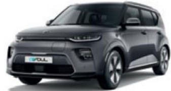
Gravity Grey (KDG)