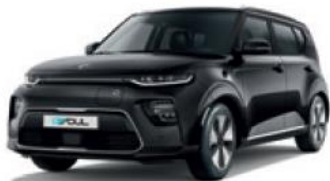
Cherry Black (9H)