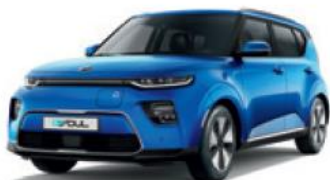
Neptune Blue (B3A)